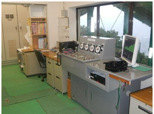
摩耶ロープウェー運転台