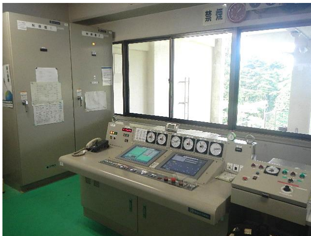
六甲有馬ロープウェー運転台、制御盤