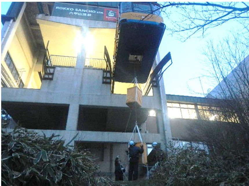
六甲有馬ロープウェー非常時救助訓練