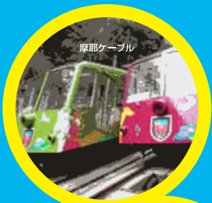
まやビューライン