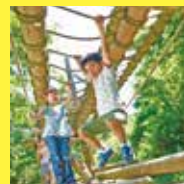
六甲山フィールドアスレチック