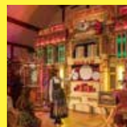
六甲オルゴールミュージアム