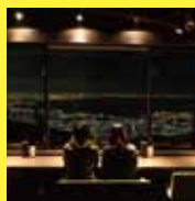
TENRAN CAFE (天覧台)