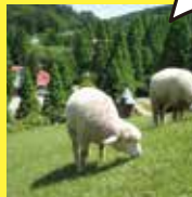
神戸市立六甲山牧場