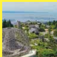
自然体感展望台 六甲枝垂れ 六甲ガーデンテラス