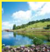
六甲山カンツリーハウス