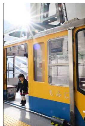
マリリン 様 「令和2年1月、ある冬の日」