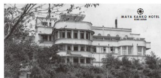
摩耶ケーブル・摩耶ロープウェー