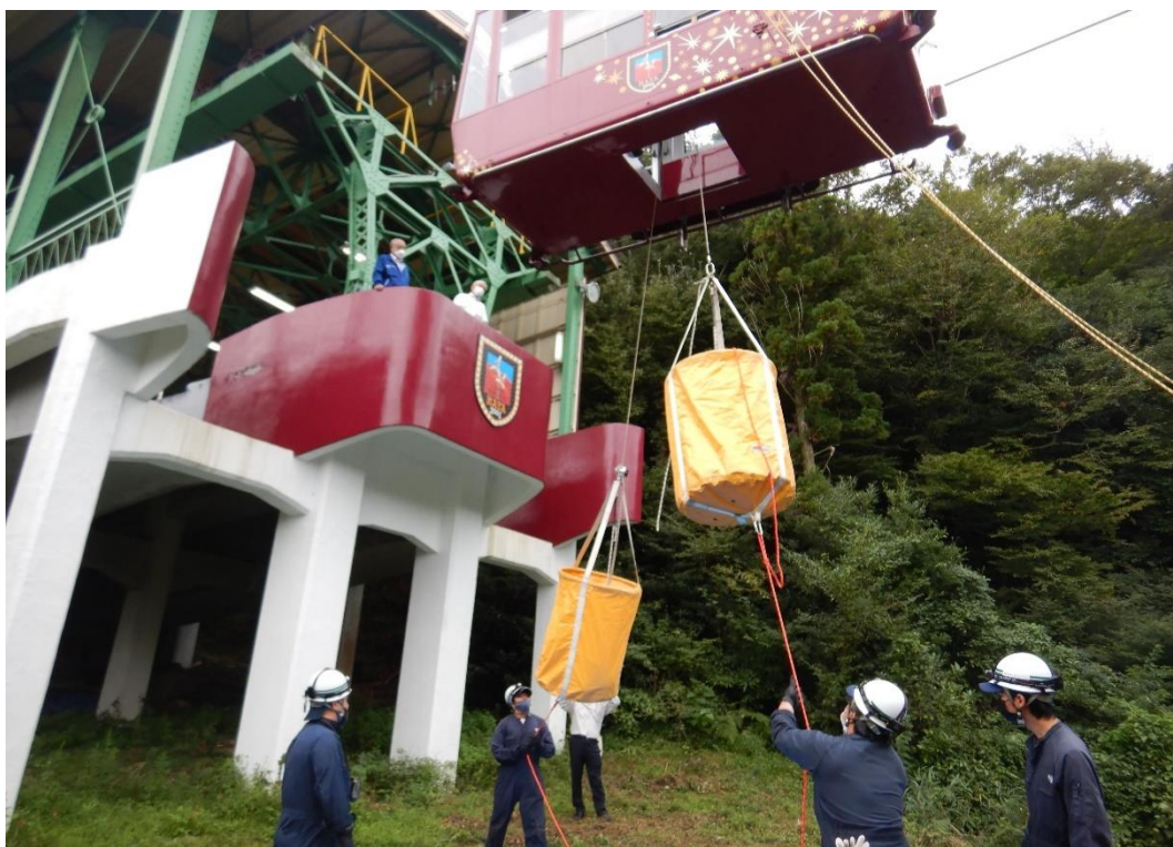
(摩耶ロープウェー乗客避難訓練)

毎年度、運転事故や災害を想定した訓練を実施しています。2021年度は、事故発生時における正確、迅速な対応を目的に緊急連絡訓練、及び乗客の救出・避難訓練を実施しました。